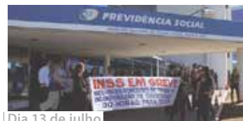
Dia 13 de julho

Trabalhadores da Seguridade Social do DF iniciaram paralisação, com ato em frente ao prédio da Previdência Social. A greve foi deflagrada nacionalmente no dia 10 de julho, pela Confederação Nacional dos Trabalhadores em Seguridade Social - CNTSS, e atinge mais de 20 estados.