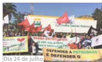
Dia 24 de julho

A greve de advertência dos petroleiros durou um dia e repudiou o novo Plano de Gestão e Negócios da Petrobras 2015/2019. Eles também protestaram contra o PLs 131, o projeto entreguista de Serra, que pode tirar da Petrobras o papel de operadora única do pré-sal.