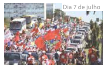
Dia 7 de julho