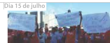
Dia 15 de julho