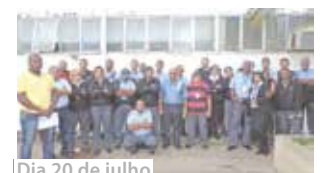
Dia 20 de julho

Com 21 dias de atraso no pagamento de benefícios, os vigilantes da empresa de segurança Sitran que prestam serviço no Palácio do Itamaraty pararam as atividades por dois dias. O pagamento dos benefícios foi regularizado após a pressão.