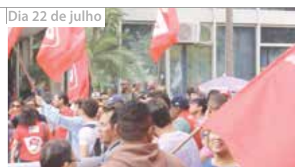
Dia 22 de julho