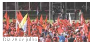
Dia 28 de julho

Várias categorias do campo e da cidade se uniram aos servidores públicos do DF na Praça do Buriti para protestar contra projetos do governo Rollemberg que lesam direitos dos servidores. Eles também repudiaram o Projeto de Lei do deputado Cristiano Araújo (PTB) que restringe o direito constitucional de manifestações dos movimentos sociais no Eixo Monumental.