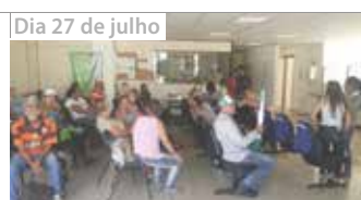
Dia 27 de julho